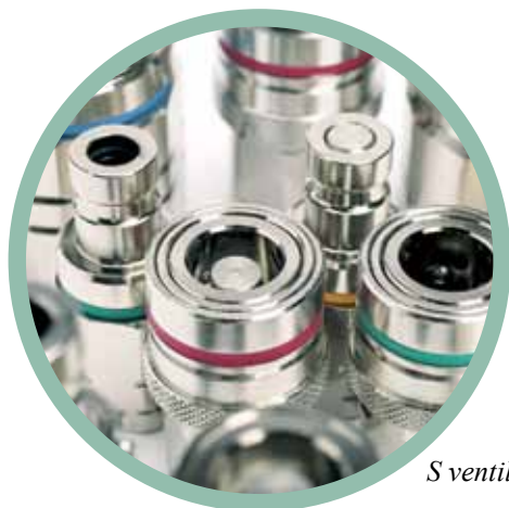
S ventilem nebo bez ventilu

Kapalinová série zahrnuje rychlospojky i vsuvky s ventily i bez nich, což dále rozšiřuje aplikační možnosti. Verze s ventilem je jednoručně ovládaná a je nejběžnější verzí používanou v kapalinových aplikacích. Díky své konstrukci je k ovládní bezventilové verze třeba obou rukou a hodí se tam, kde únik kapaliny při rozpojení nezpůsobí problém.